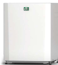
CTC EcoPart 406-412/600M