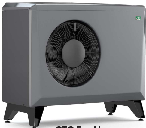
CTC EcoAir 406-408/600M

– för mer utförlig information se respektive produktblad.