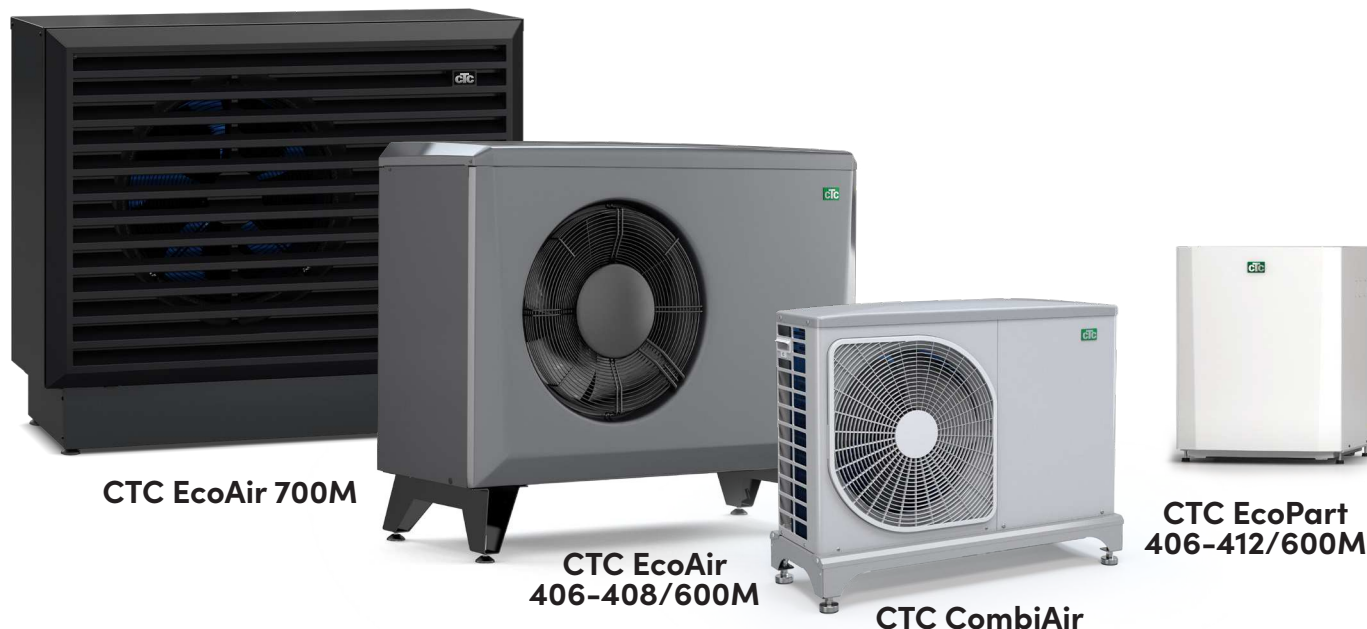
CTC EcoAir 700M

– pour des informations plus détaillées, voir leur fiche technique.