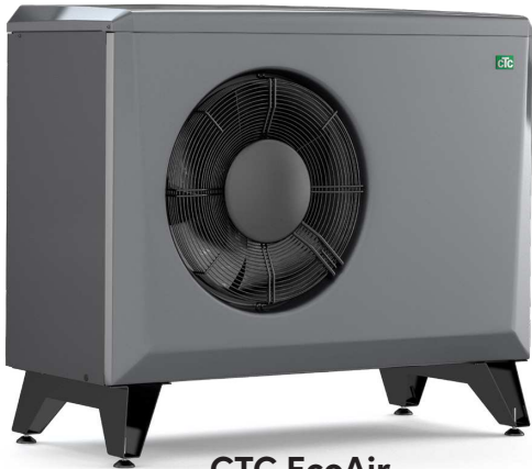
CTC EcoAir 406-408/600M

– lisätietoja on pumppujen tuote-esitteissä.