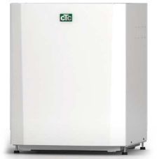
CTC EcoPart 406-412/600M